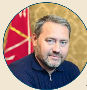
АЛЕКСАНДР БЕЛЬСКИЙ, председатель Законодательного собрания:

— Главный финансовый документ города закладывает новые возможности для Петербурга — на десятилетия вперед. И в то же время имеет выраженный социальный характер. Только все вместе мы сможем реализовать нашу основную задачу: развивать Петербург как мегаполис XXI века — самый привлекательный город для жизни.