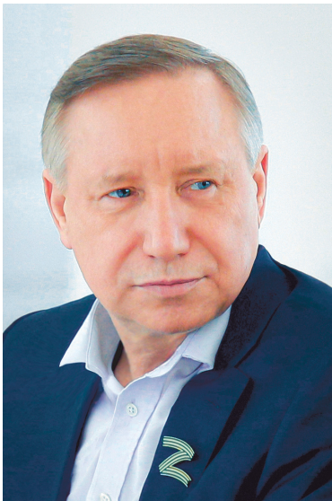
АЛЕКСАНДР БЕГЛОВ, губернатор Санкт-Петербурга

Петербург должен сохранить лидерство в реализации национальных проектов. Об этом губернатор Александр Беглов заявил 2 декабря на заседании городского правительства в ходе рассмотрения вопроса о выполнении городом указа президента РФ «О национальных целях развития Российской Федерации на период до 2030 года и на перспективу до 2036 года». «Город на 100% выполнил поставленные президентом задачи. Мы добились