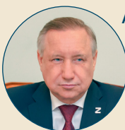
АЛЕКСАНДР БЕГЛОВ, губернатор Санкт-Петербурга:

— Главный финансовый документ города закладывает новые возможности для Петербурга — на десятилетия вперед. И в то же время имеет выраженный социальный характер. Только все вместе мы сможем реализовать нашу основную задачу: развивать Петербург как мегаполис XXI века — самый привлекательный город для жизни.